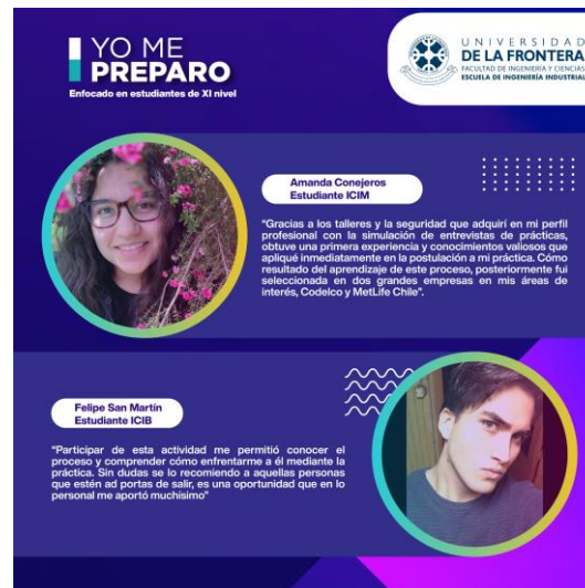
Figura 2: Testimonios participantes versión piloto 2021

Respecto a la evaluación del proceso de entrevistas simuladas, donde participaron 13 organizaciones y 15 estudiantes, se planificó un taller grupal para compartir impresiones generales y áreas de mejora. En la figura 2 se presentan dos de los testimonios recogidos.